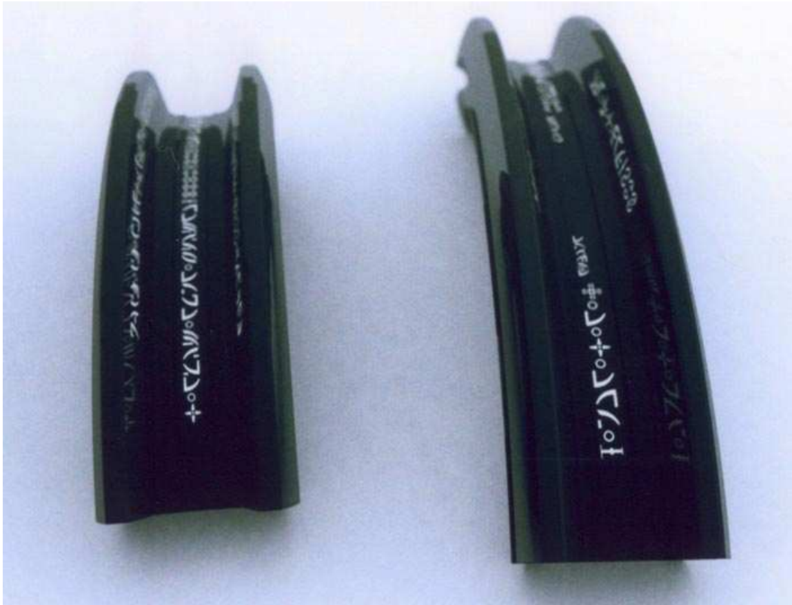
Figure 4.3 Vue du dessus des segments de poutrelle en I.