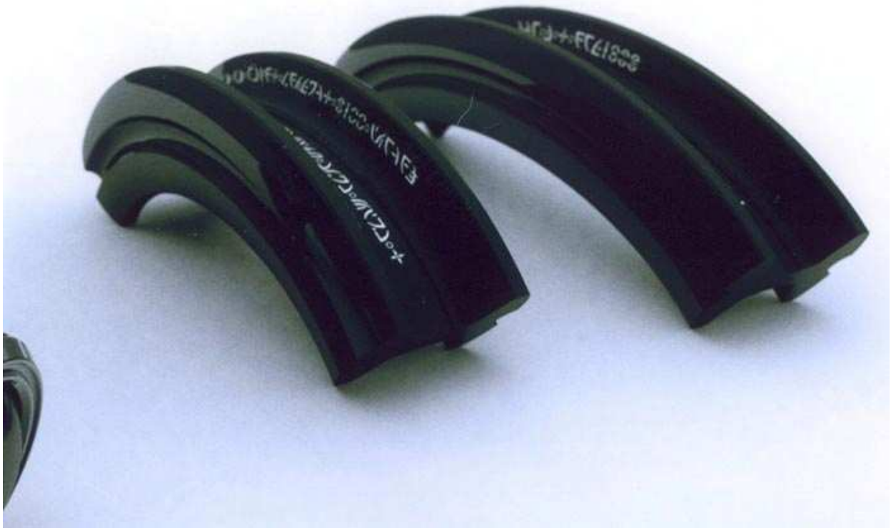
Figure 4.2 Gros plan des segments de poutrelle en I.

chacun se terminant par un 'pied' circulaire d'un diamètre de 5 (,08 ndt) centimètres. L'appareil pèse environ 1,899 kg.