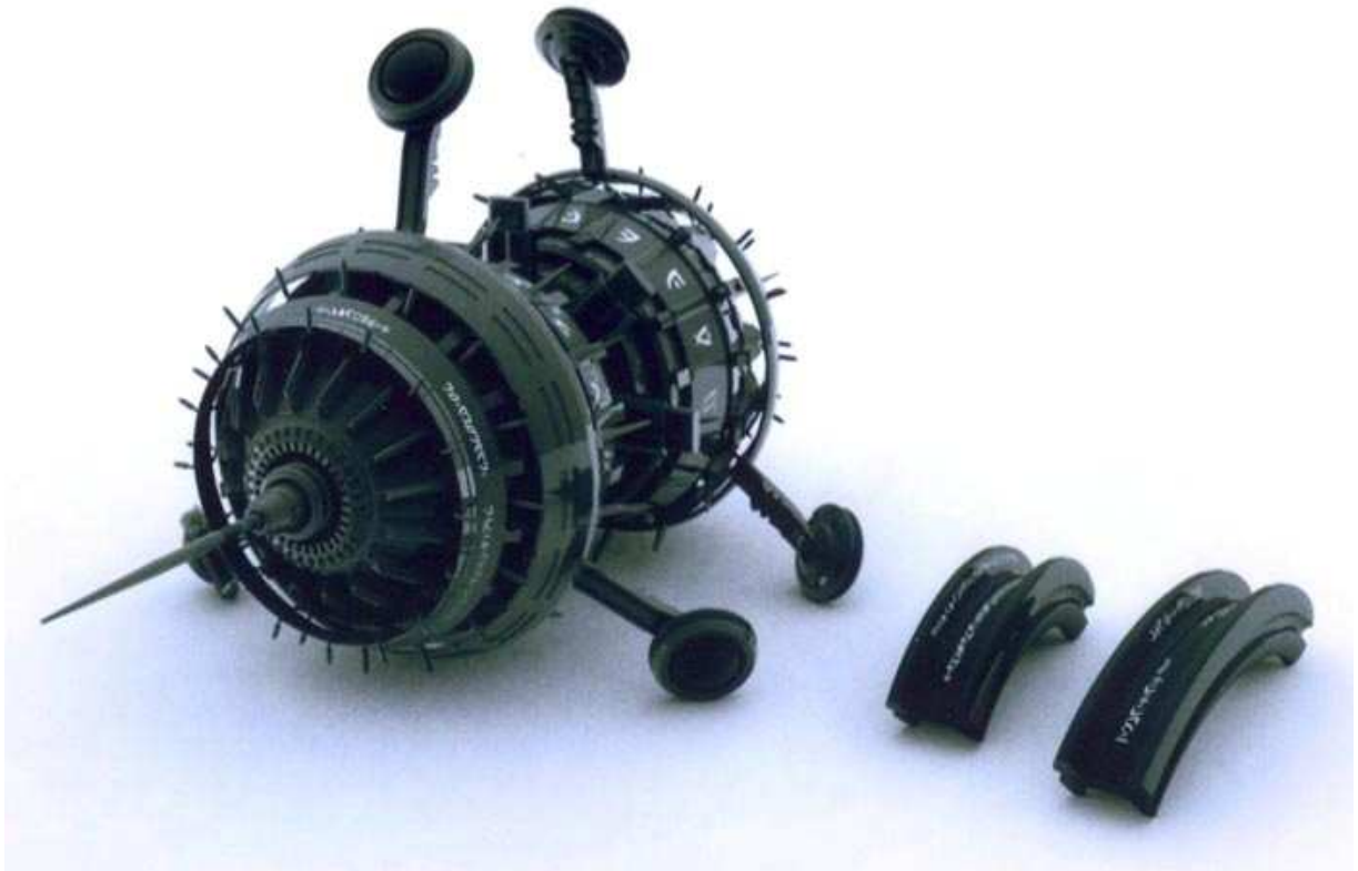
Figure 4.1 L'artefact utilisé par le PACL lors sa phase de recherche antigravité du Q4-86.

étaient directement et physiquement reliés et sont absolument inséparables en les tirant ou en les poussant dans des directions opposées. C'est seulement quand l'effet de A1 est désactivé qu'ils se comportent de nouveau comme des objets séparés.